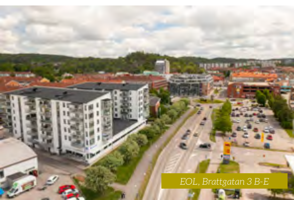
EOL, Brattgatan 3 B-E