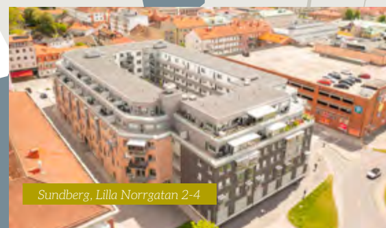
Sundberg, Lilla Norrgatan 2-4