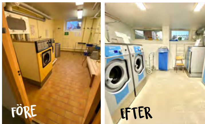
Renoveringarna innebär bland annat nya, mer energieffektiva maskiner.

– I många av våra fastigheter har vi två bokningsbara tvättstugor. Då låter vi den ena vara öppen under tiden som vi renoverar. Då