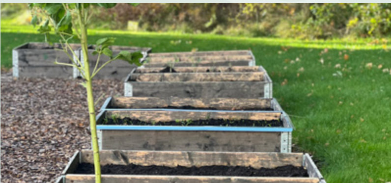
Pallkragarna möjliggör härlig odling av allt från grönsaker till vackra perenner.