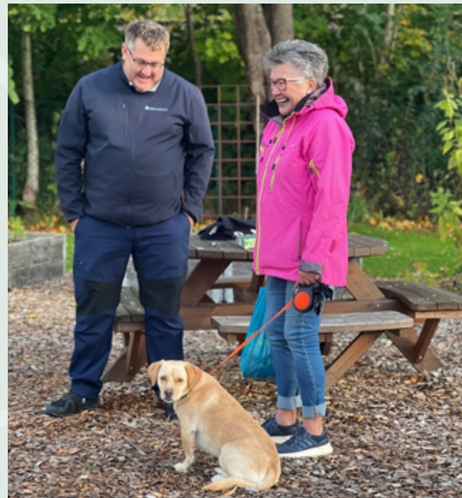
Urban Gardening blir en naturlig mötesplats för våra anställda och de boende.