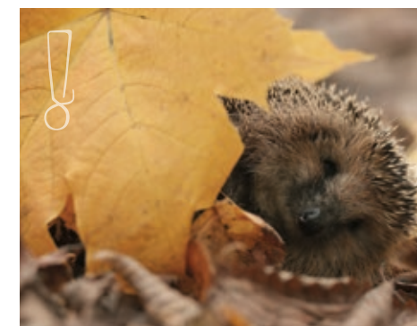
Vi har Urban garden samt Igelkottshotell på flera platser i Norr, Söder och Ljungskile.